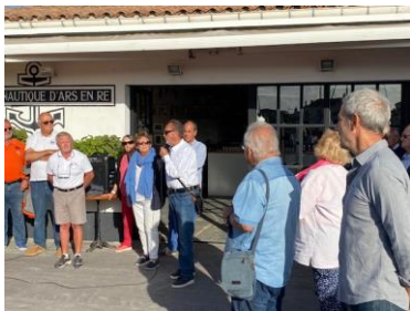
SOIREE SNSM AU CNAR

Du 20 septembre au 25 septembre : Grand Pavois La Rochelle