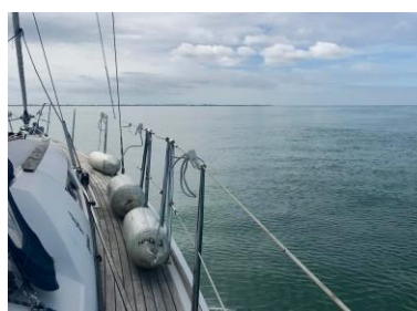
EN ROUTE SUR ST DENIS