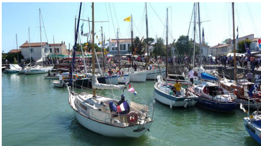
Fête de la sardine et du port samedi 20 juin 2009

14/08/09 Assemblée Générale AUPAR, remise du livre des 20 ans de l'AUPAR suivie d'un apéritif offert et du repas traditionnel sur le port, inscriptions à nous renvoyer le plus tôt possible.